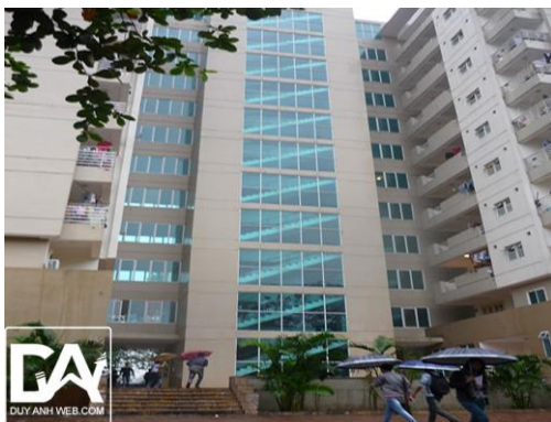
Ảnh 3: Hình ảnh Ký túc xá sinh viên