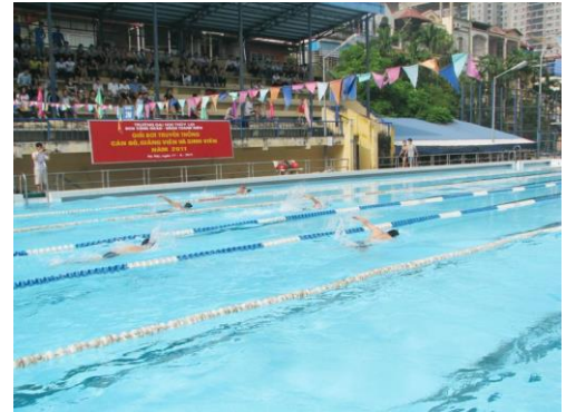
Ảnh 4: Hình ảnh Bể bơi Trường đại học Thuỷ lợi