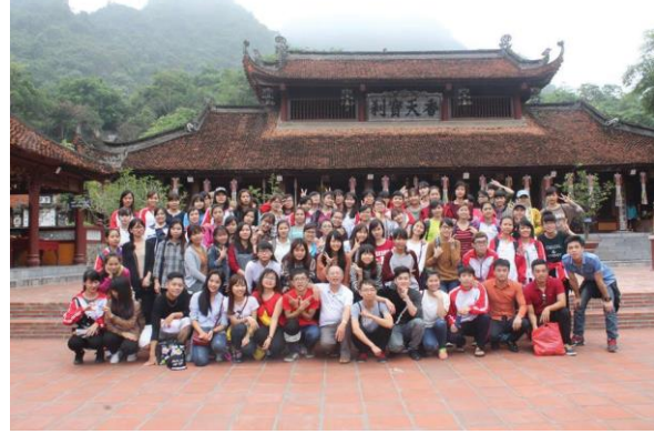
Ảnh 8: Đi thực tập Địa lý thủy văn ở Chùa Hương

5. Chỉ tiêu tuyển sinh hàng năm: từ 80 đến 100 sinh viên