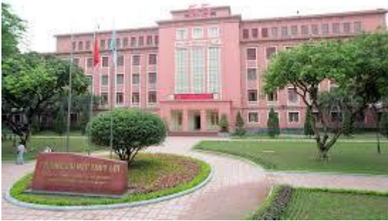
Ảnh 1: Hình ảnh trường Đại học Thuỷ lợi