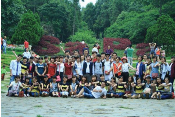
Ảnh 7: Đi thực tập khí tượng ở SaPa