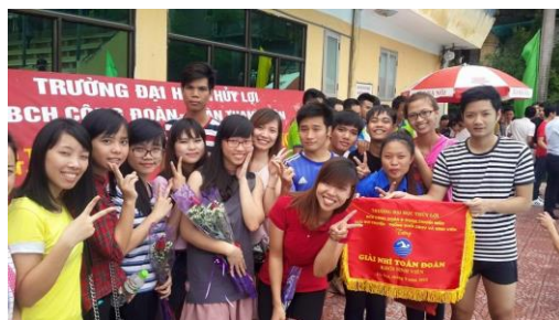
Ảnh 9: Hoạt động ngoại khóa