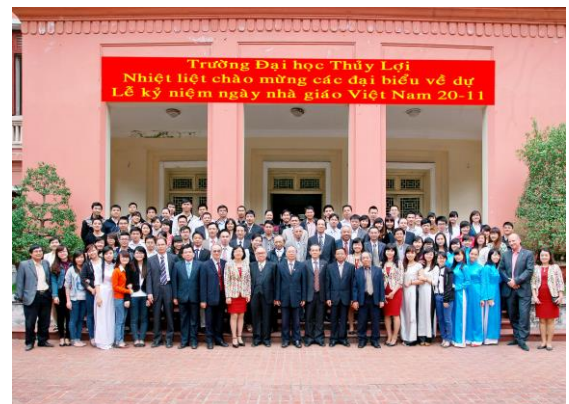
Ảnh 5: Cán bộ giảng viên Khoa Thủy văn