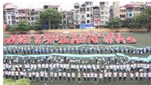
Ảnh 6: Sân bóng cỏ nhân tạo